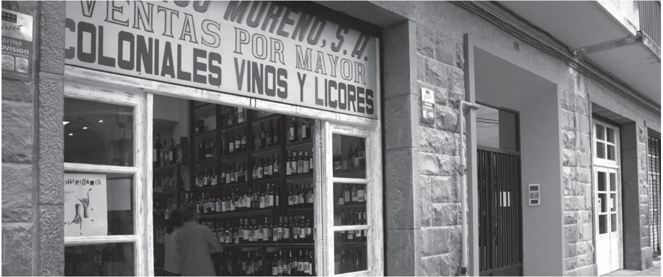
Aspecto actual de la tienda. Abajo, dos imágenes del establecimiento de la calle Mayor, con más de cuarenta años de diferencia entre ellas.