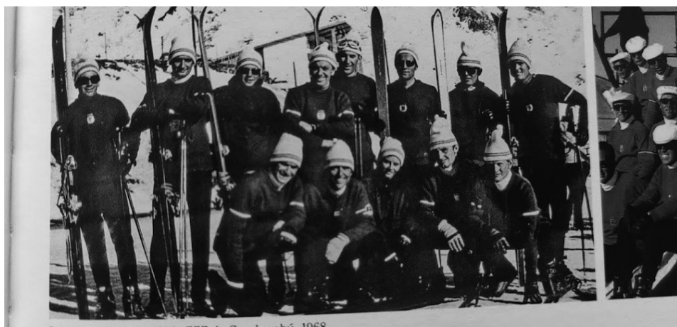
Primeros profesores de la EEE de Candanchú 1968.